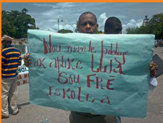
Manifestante de REPT muestra un cartel que demanda escuela pública y gratuita para todas las personas.