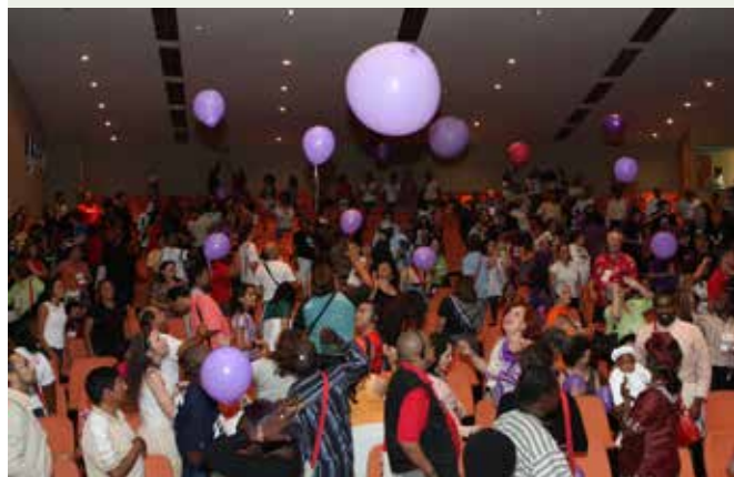
Inauguración del FISCS 2009.