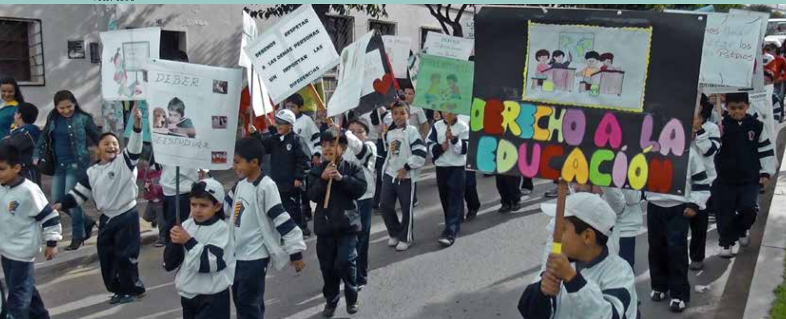
Niñas y niños demandan su derecho a la educación en actividad de la Semana de Acción Mundial 2012.