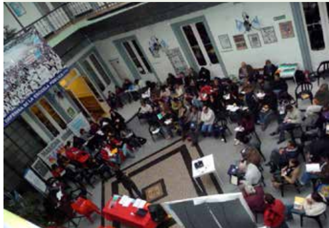
Reunión de incidencia en Buenos Aires (2010).