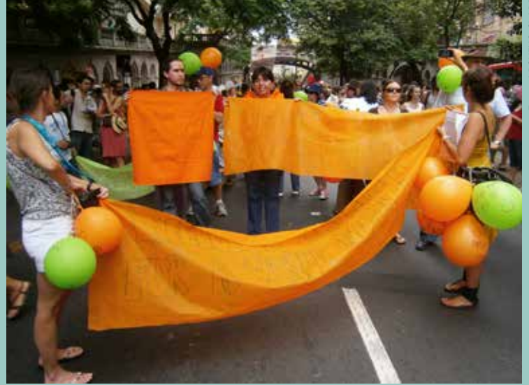
Marcha de apertura del Foro Social Temático y Foro Mundial de Educación 2012.

incidencia desde la sociedad civil en la definición de las Metas Educativas 2021. La articulación comenzó en 2010, cuando la Organización de los Estados Iberoamericanos (OEI) anunció su intención de establecer un acuerdo entre los gobiernos iberoamericanos alrededor de un proyecto de educación para las próximas generaciones, lo que se resumió en el documento de propuestas intitulado Metas Educativas 2021: La educación que queremos para la generación de los Bicentenarios .