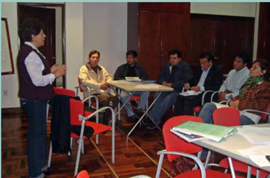
Representantes de la Campaña Boliviana durante reunión de incidencia política.